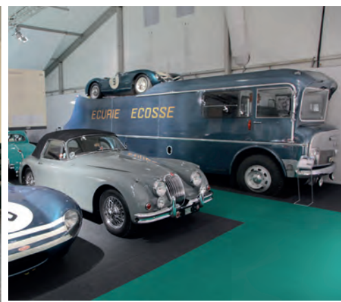
Breites Spektrum: drei Vorkriegsmodelle der Jaguar-Vorgängermarke S.S. (oben), der noch unrestaurierte Jaguar Mk IV von 1947 mit Reinbolt & Christé-Aufbau aus dem Jahr 1948 (unten links) sowie der mit einem C-Type beladene, elegante Renntransporter der schottischen Ecurie Ecosse, die zweimal Le Mans gewonnen hat (unten rechts).